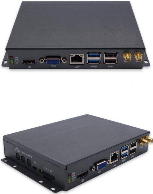
(图片仅供参考，产品细节以规格为准)