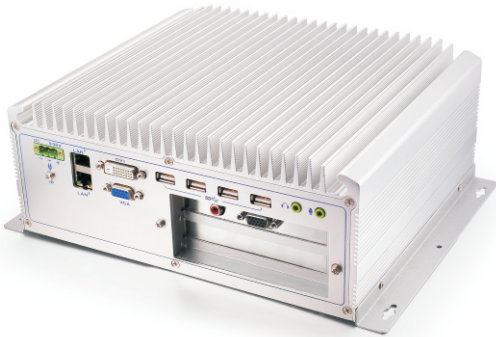
(图片仅供参考, 产品细节以规格为准)